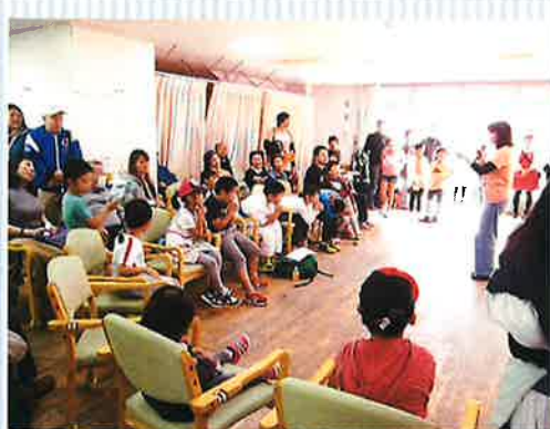
↑ドキドキ抽選会は午前午後の2回に分けて開催しました。会場内は熱気ムンムン！