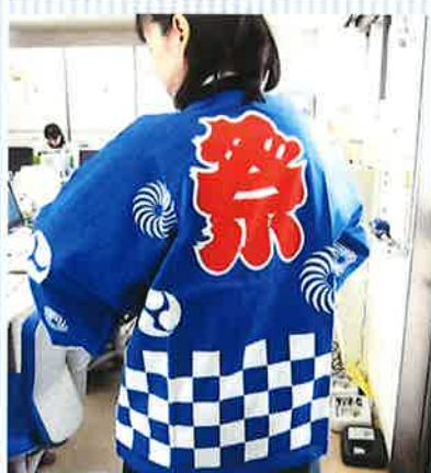
↑青いはっぴがステキです