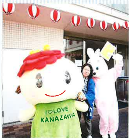
↑ぼたんちゃん、うさぎさんも応援に駆け付けてくれました！

11月2日に第2回柳町ふれあい感謝祭が開催されました。ご来場していただいた皆さま、ボランティアの皆さま、ありがとうございました。 今回柳町地域ケアプラザ開所10周年の記念ということで、いつもより盛大に皆さまをお迎えしました。11年目もますます地域に必要とされるケアプラザを目指し、職員一同努めていきたいと思っております。