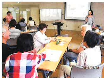
7月 笑いのたえない栄養講座

介護予防の基本は・・・ しっかりおいしく食べることができ、 元気に動くことができること。 そして何より笑い合えるお仲間がいる事です。