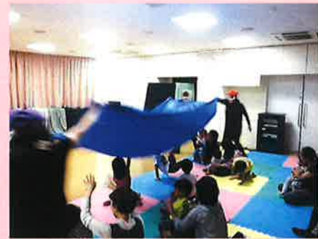
ケムケム座公演 ゆうびんうさぎとおおかみがぶり 次回は12月14日です☆