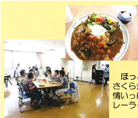
ほっとランチ さくら会さんの愛情いっぱいのカレーライスでした。