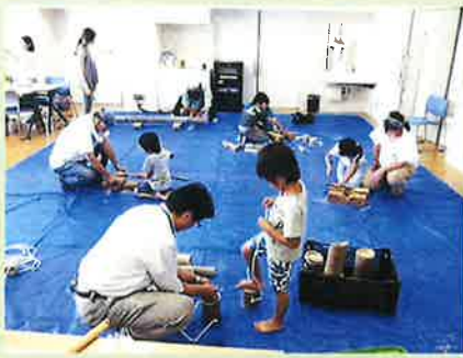
木工クラフト 夏休みの宿題？素敵な作品を作っていました。