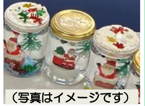
(写真はイメージです)