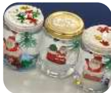
(画像はイメージです)

主催：横浜市富岡地域ケアプラザ・横浜市柳町地域ケアプラザ・横浜市釜利谷地域ケアプラザ