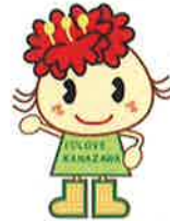
金沢区幸せお届け 大使ぼたんちゃん