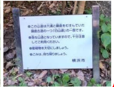
新しくなった看板