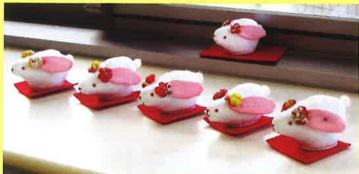
うさぎさん、全員集合♪

小物づくり講座の参加者さんが お手伝いに入ってくださいまし た。ありがとうございました。