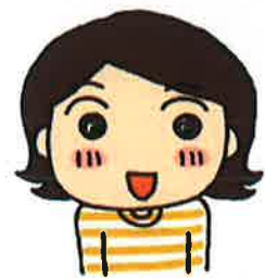
イラスト/フカザワナオコ