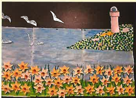
まだ寒い海の傍らで可憐に咲く水仙