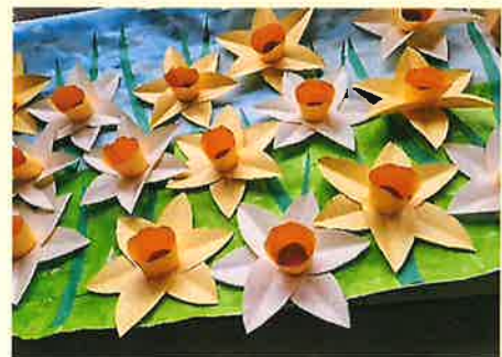
水仙の花は立体的に作っていただきました