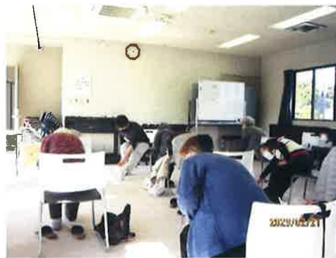
ストレッチも大事です

★ 今後の予定 ★ (仮)フレイル予防 『食事と運動』 5月18日(木) 14:00～15:30 会場：多目的ホール 参加費：無料 お電話でお申込みください