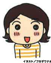
イラスト/フカザワナオコ