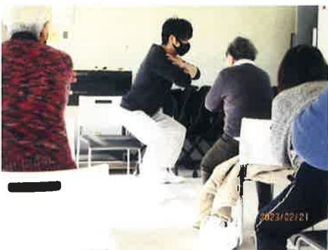
膝を傷めないようにスクワット

今年度も皆で一緒に健康づくりをしていきましょうね。よろしくをお願いいたします。 (ケアプラザの講座では、もうしばらくマスク着用のご協力をお願いいたします。)