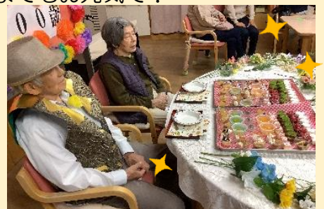
スイーツバイキングでお祝い♪