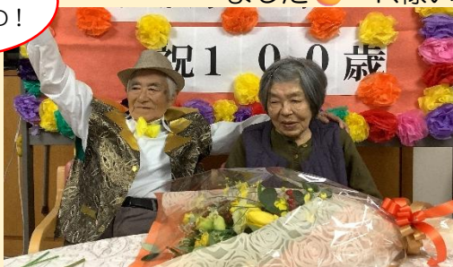
奥様の肩に手を回してお二人で記念撮影♪