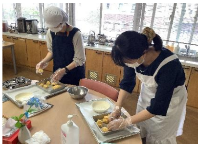
栄養士さんとアシスタント (ケアマネさん)