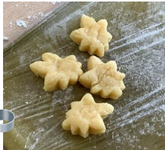
①生地を型抜きして