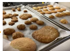
④美味しいクッキーの出来上がり~