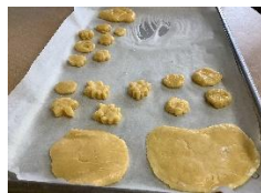
③オーブンで焼いたら