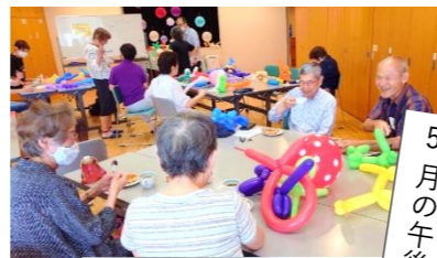
5月の午後カフェの様子です